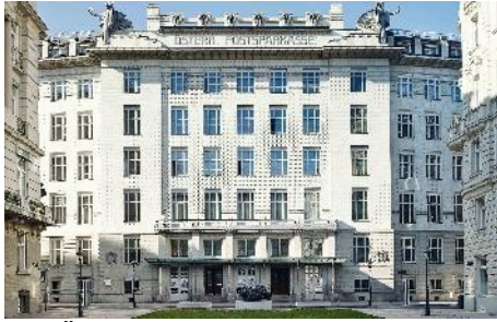
Die Österreichische Postsparkasse